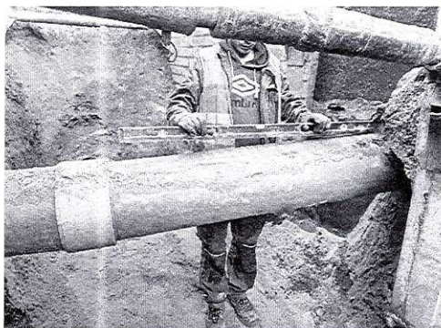
80047b94-94c8-4efd-a216-55ffe660f8c5.jpg ~407 KB