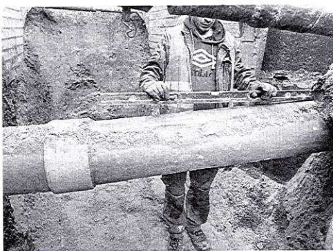
c8da878c-69ea-475d-a8e9-847b8d1f410a.jpg ~546 KB