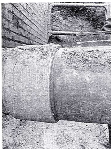
6b68b82b-ffeb-4671-8d61-9f0ea87219d8.jpg ~417 KB